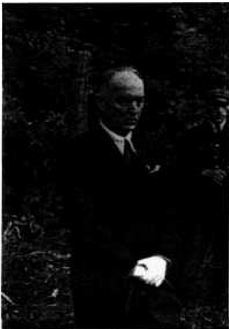
Mareșalul Ion Antonescu, rugându-se, calm și demn, cu puține momente înainte de execuție