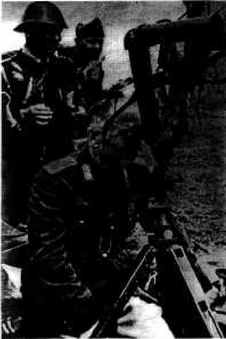
Ion Antonescu în Basarabia