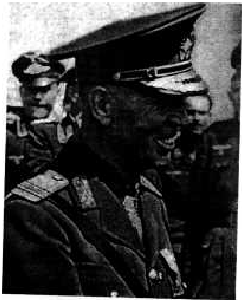
Mareșalul Ion Antonescu printre ofițeri