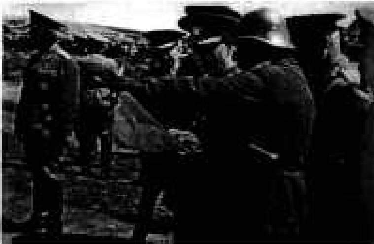
Mareşalul Ion Antonescu, gri. Petre Dumitrescu, pe front