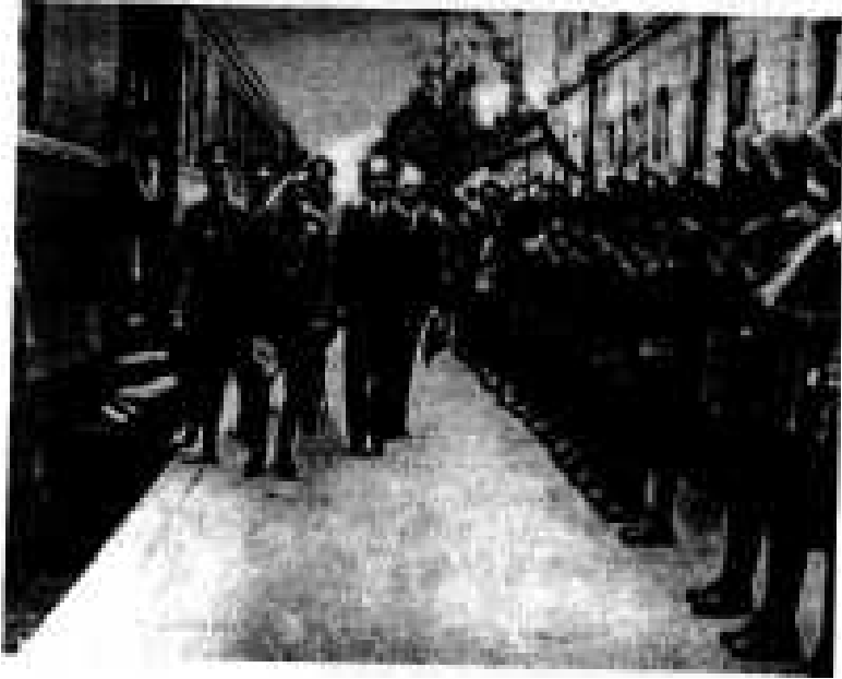
Mareșalul Ion Antonescu și guvernatorul Transnistriei prof. Gheorghe Alexianu în gara de la Tiraspol