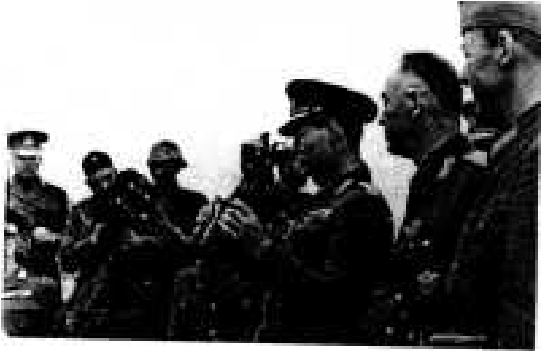
Regele Mihai I și general Ion Antonescu inspectând linia frontului, Basarabia.