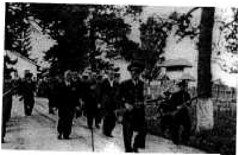
Mareșalul Ion Antonescu, împreună cu Mihai Antonescu, Gheorghe Alexianu și Constantin Vasiliu sunt escortați pe ultimul drum