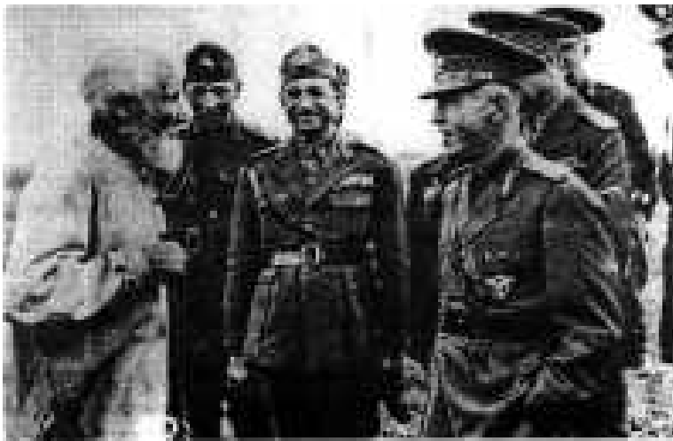
în Ucraina, întreținându-se cu un bătrân moldovean care participase în războiul din 1877 pentru independență