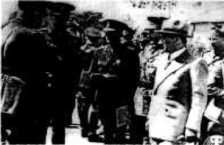
MS Regele, D-I Mareşal Ion Antonescu și D-I profesor Mihai Antonescu, Preşedintele Consiliului de Miniştri în inspecţie pe Frontul de Răsărit la Mariopol