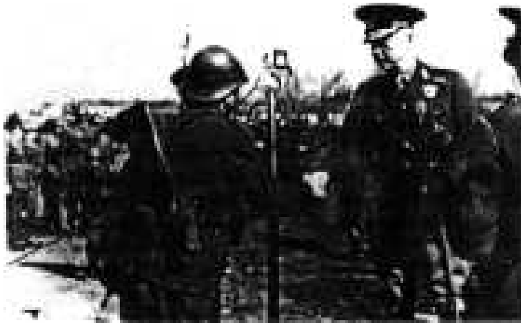
Mareșalul Ion Antonescu strânge mâna unui ostaș