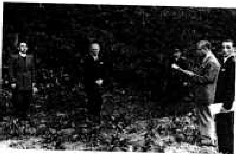
Li se citește verdictul de respingere a cererilor de comutare a pedepsei cu moartea