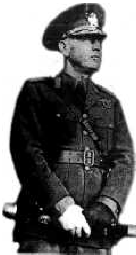
Mareșalul Ion Antonescu, conducătorul statului (1940-1944)