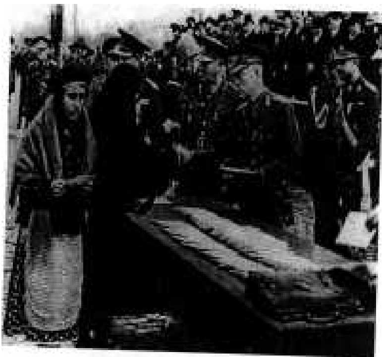
Răsplătirea vredniciei, a devotamentului și a jertfei celor care au căzut pentru pământul strămoșesc, după cucerirea Odesei